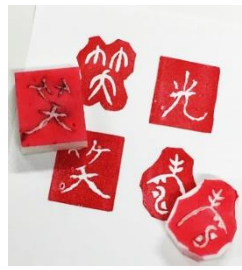
消しゴムはんこを作ろう！