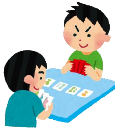
カードゲーム体験会