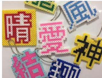
アイロンビーズで漢字！