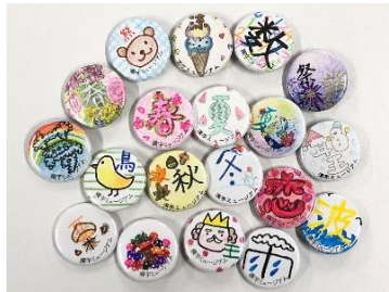
漢字缶バッジ作り！