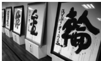
▲歴代26枚の大書を展示 (画像は過去の企画展の様子)

「今年の漢字」開催当初の1995年から2020年までの大書現物をすべて展示します。 日本の世相の移り変わりを迫力の 大書とともに楽しみください。