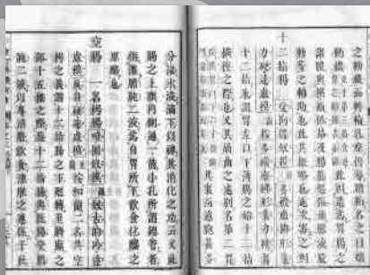
おおつきげんたく 大槻玄沢「重訂解体新書」 「翻訳新定名義解」(1826年) 西洋の解剖学書の翻訳語をまとめた術語集。「十二指腸」という翻訳語ができた経緯について書かれている。