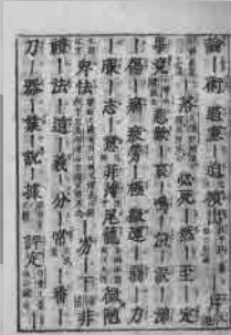
まきのしまてるたけ わかんおんせきしよげんじ こうせつようしゅう 横島昭武「和漢音釈書言字考節用集」(1717年) 江戸時代に作られた辞書的一种。ことばを領域ごとに分類したのち、イロハ順に並べている。このページには「卑怯」ということばが見える。