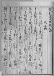
かねわかくぞう とこうじい 金内格三『徒紅字彙』(1860年) 江戸時代に作られた中国語の口語語彙集のひとつ。「花魁 ライラン」ということばが見える。