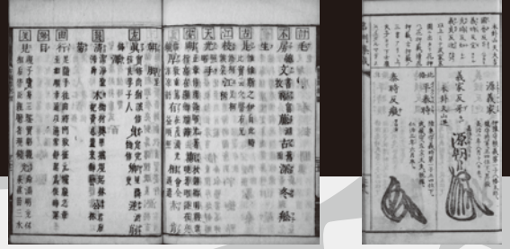
展示物（右）「和蘭雅」（貝原好古、1694年。）

子どもの名前にはどんな漢字を使ってもいい？「キラキラネーム」ってどういう名前のこと？姓名判断って昔からあるの？など、名前にまつわる疑問は尽きません。この企画展では、日中の名前に関する文化をわかりやすくご紹介するとともに、大量の名前データをもとに、現代人の名前に使われる漢字について紹介します。思わず「へえ～」と言いたくなる展示をご覧ください。