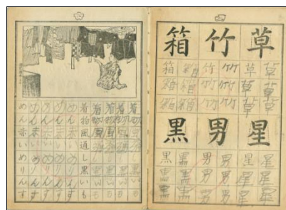
▲『硬筆練習帳』 (ペン文字会編、大正15年)