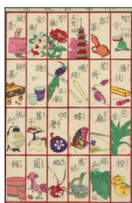
▲『小学指数図』 (明治時代)

【期間】開催中～2021年1月5日(火)※期間を変更して開催 【場所】漢字ミュージアム2階 【料金】入館料のみ