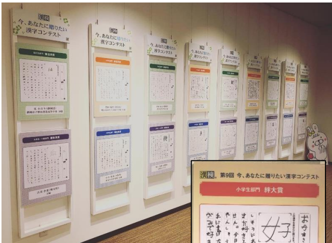
▲ 展示の様子 ▶ 絆大賞作品（小学生部門）

■「今、あなたに贈りたい漢字コンテスト」は、家族や恋人、友人や恩人、そして自分自身にあてて、日頃は言えない素直な気持ちを漢字一字に託して贈るイベントです。漢検協会が主催しており、2020年度・2021年度開催の受賞作品の中から、各20点を展示しています。心温まり、また、少し考えさせられる作品をどうぞご覧ください。