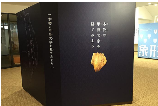
▲「本物の甲骨文字を見てみよう」コーナー

公益財団法人 東洋文庫から新たに甲骨資料をお借りして、5月から展示しています。本物の甲骨文字を見られる館はそう多くありません。中国の河南省安陽市にある「殷墟」から発掘された本物の甲骨を、ぜひこの機会にご覧ください。