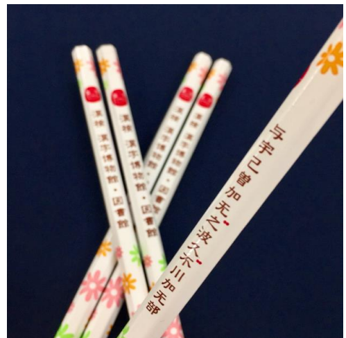
▲漢字ミュージアムオリジナル鉛筆

当館は6月29日に開館6周年を迎えます。みなさまへ感謝の気持ちを込めて、6月29日(水)～7月3日(日)は来館者全員に漢字ミュージアムオリジナル鉛筆をプレゼントします。